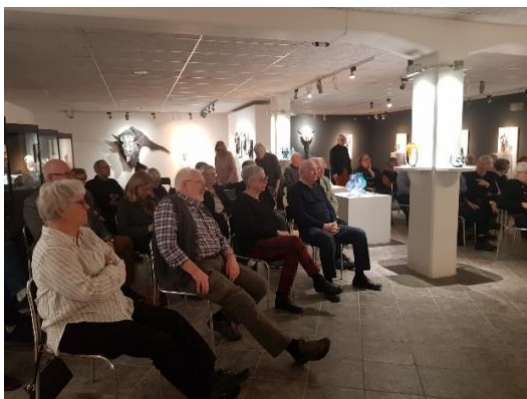
Mycket intresserade åhörare!